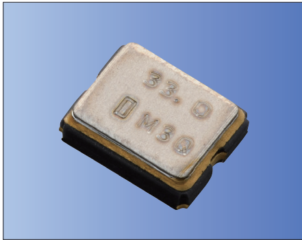
AEC-Q100/ 200 RoHS対応品