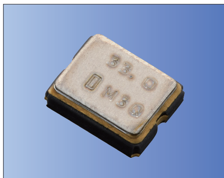
AEC-Q100/ 200 RoHS対応品